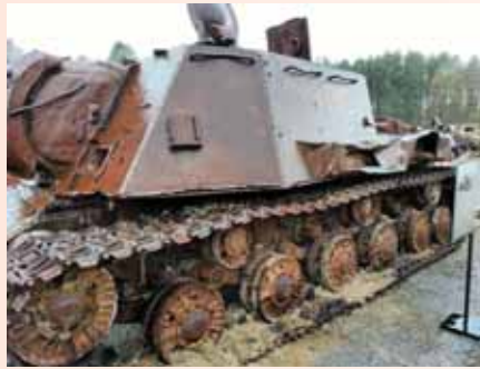
Експозиція «Виставка техніки». Танк, залишений на звалищі

Сутінки опустилися на землю, русалки у світло-блакитному одязі виходять з води на