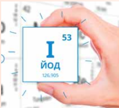
54. Оздоровче харчування