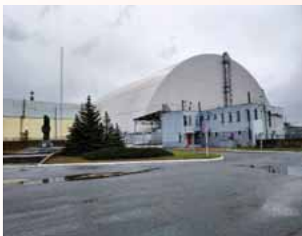
Саркофаг над Четвертим блоком ЧАЕС

печерах. Колишній міський стадіон вкриється густим молодим лісом, де знаходитимуть притулок лосі, олені та косулі. В зоні облаштуються навіть ведмеді та коні Пржевальського.