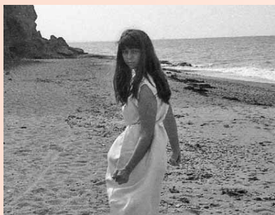
46. Викрадена з раю