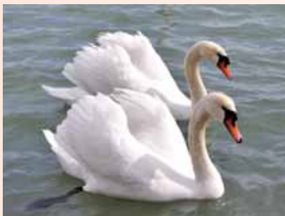
51. Сувій життєвих історій