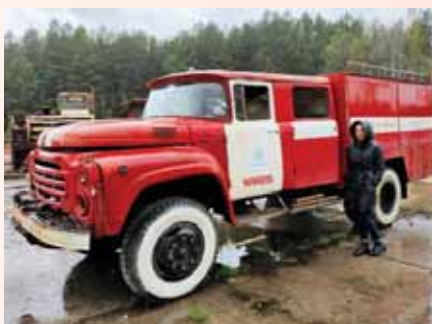
Покинута техніка «Чорнобиль» після ліквідації аварії