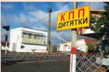
Контрольно-пропускний пункт в зону відчуження ЧАЕС