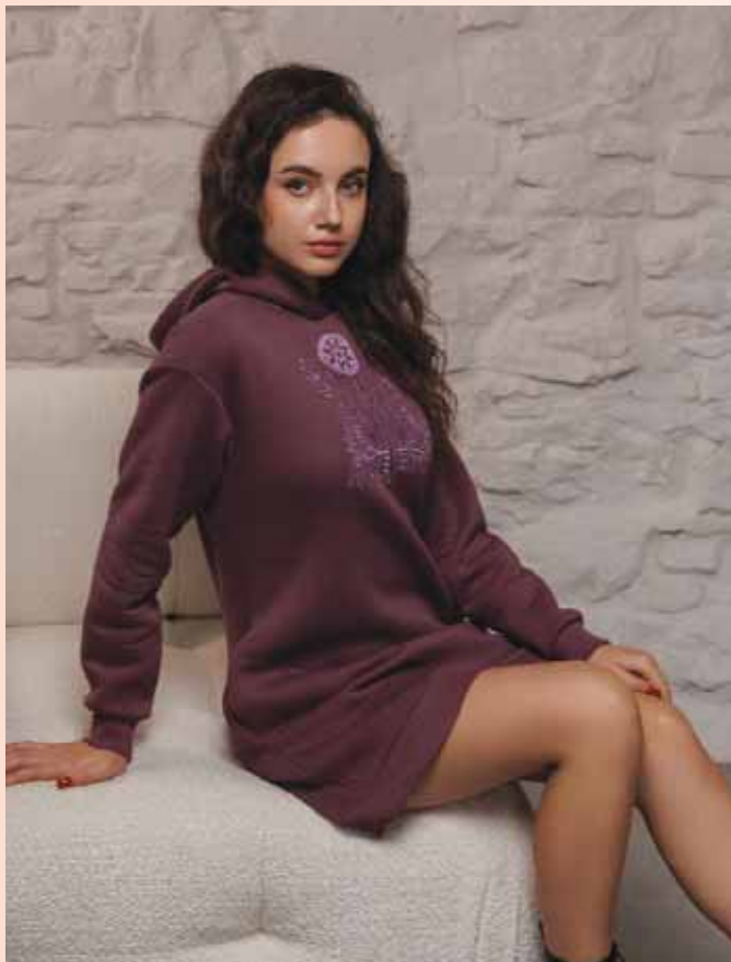
Вишивка на одязі - прекрасний спосіб підкреслити стиль і яскравість характеру.

«Фолк мода» – це інтернет магазин національного одягу, який поєднує в собі народні традиції та актуальні тренди. Вишиванка українська давно завоювала любов усього світу та місце на подіумах, червоних доріжках та важливих дипломатичних