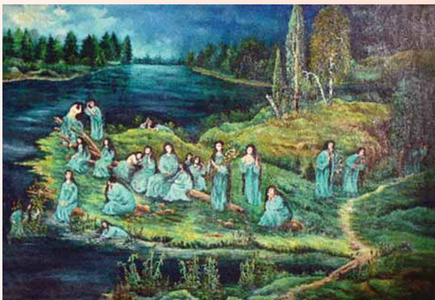
Микола Пінчук. Русалчин Великдень. 1981. Полотно, олія. 86x120. Картина друга