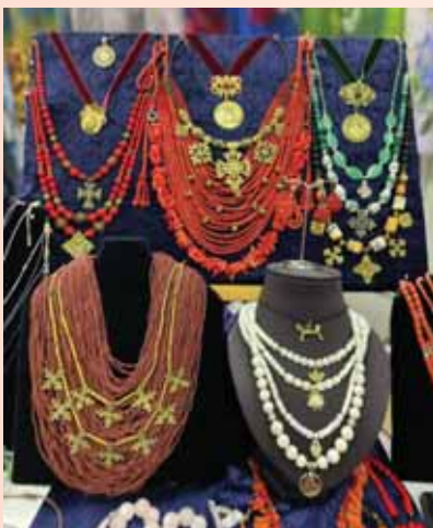
42. «Золотий спадок України» як відзнака якості національного українського продукту