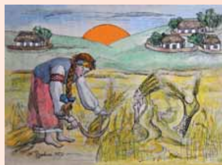
У цих місцях якась незламна сила, що рве нам душу, тягне, як магніт. 1973. Акварель, туш. 31,5x43,5

Пізніше Володимир Шерстюк розкаже мені про найстрашнішу техногенну світову катастрофу – про аварію на Чорнобильській АЕС, де він буде одним з ліквідаторів: