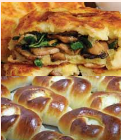
56. СМАЧНО і КОРИСНО