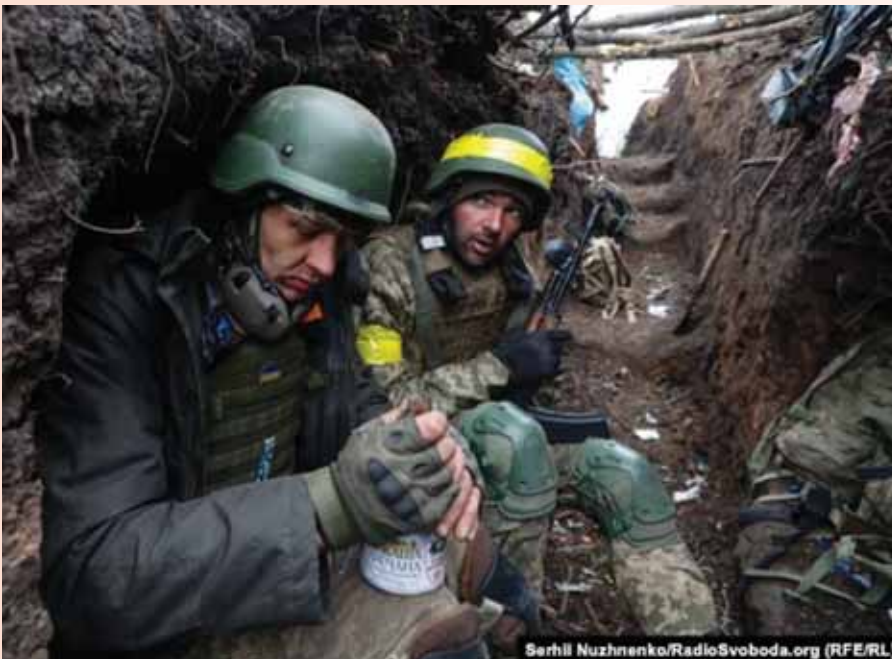
Українські військові на передовій під Бахмутом. Травень 2023 року

Важливою складовою відновлення ветеранів також є їхня участь у різних рекреаційних заняттях. Це екскурсії, настільні ігри, кулінарія, спорт, PЕT-терапія (взаємодія з тваринами), активний відпочинок на свіжому повітрі. Такі ак-