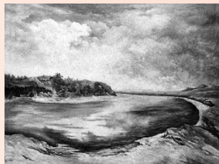
Микола Пінчук. Русалчине озеро. 1976. Полотно, олія. 2016