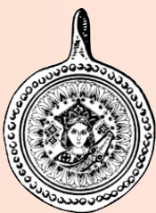
43. Синівська любов